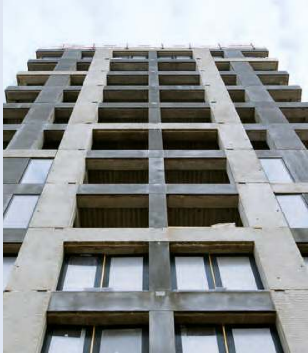
Strandtårnet på Amager Strandvej på 14 etager og med 180° udsigt over by og hav.