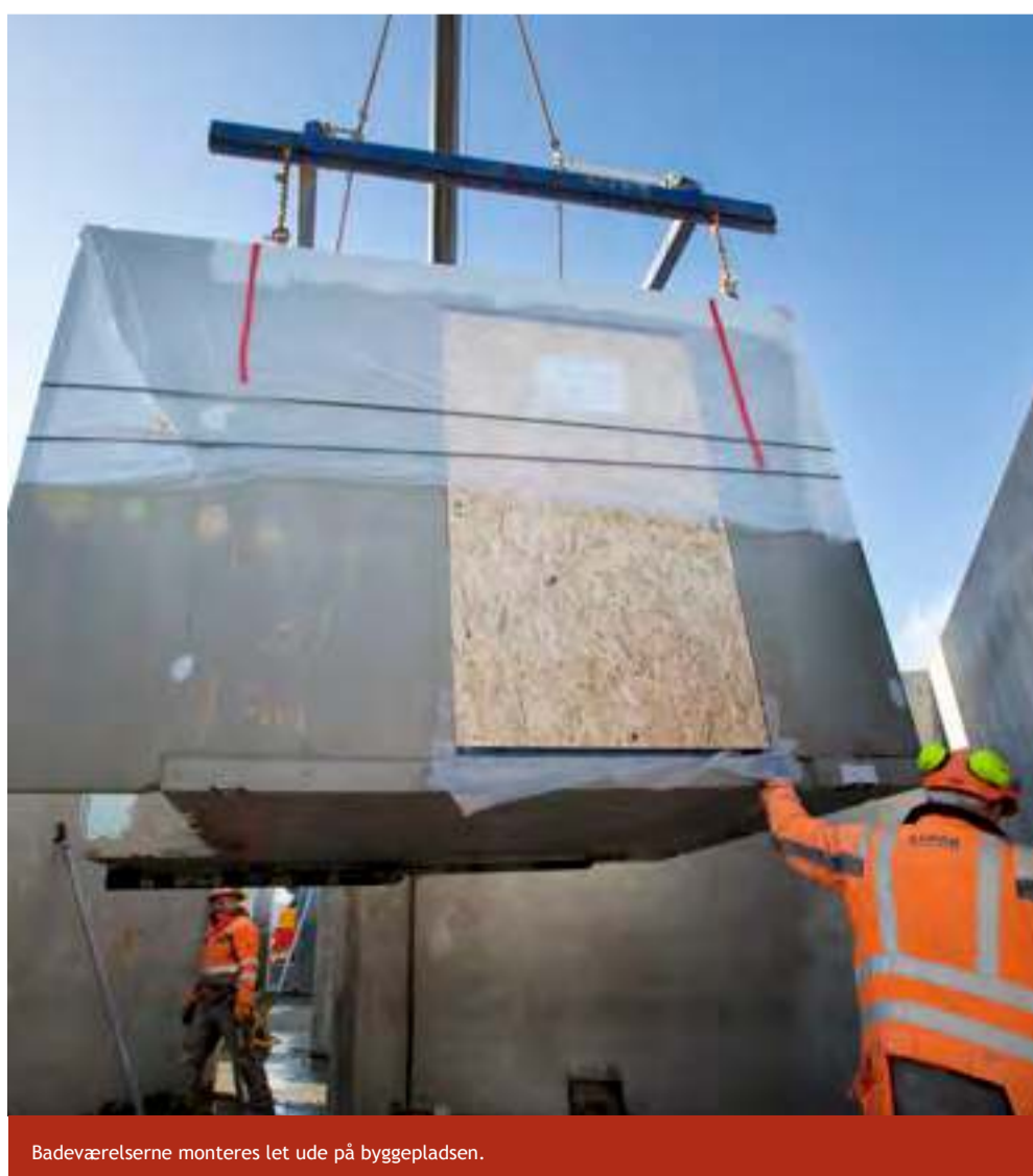
Badeværelserne monteres let ude på byggepladsen.