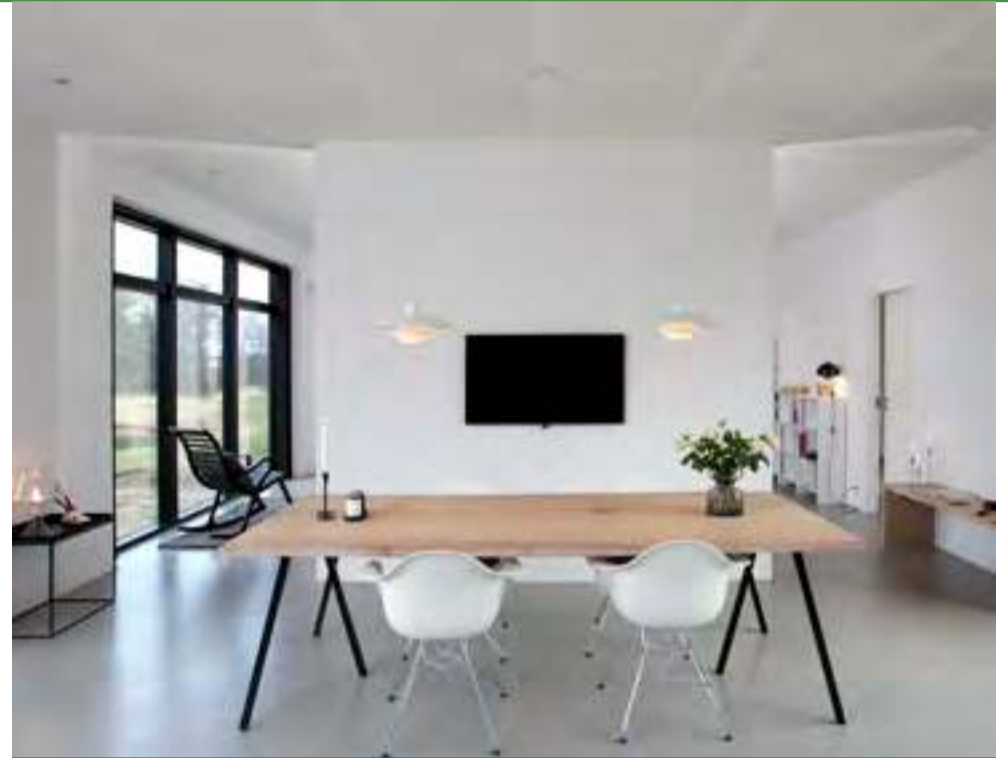
Byg med EXPAN. Byg sundt, solidt og miljørigtigt.

Vægelementer i letbeton akkumulerer varme i løbet af dagen og afgiver den igen i løbet af natten. Derfor kan du sagtens bygge med store vinduer.