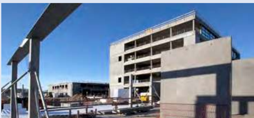
Nyt psykiatrisygehus i Slagelse, som samler hele psykiatrifunktionen i Region Sjælland.