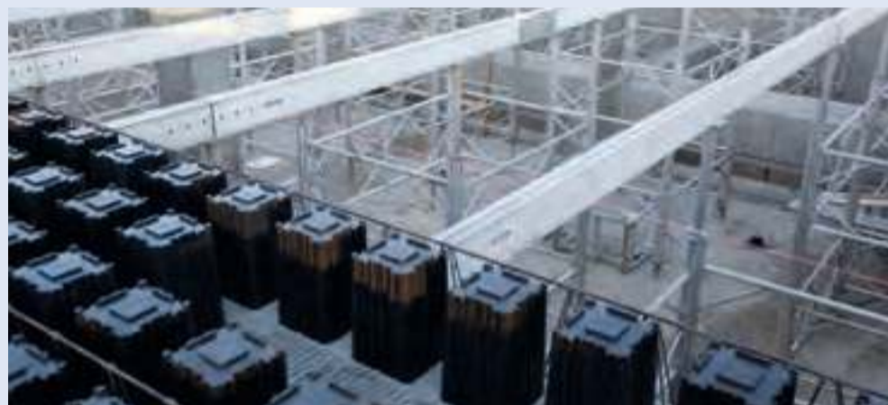
AirDeck på vandtanken i Viborg.