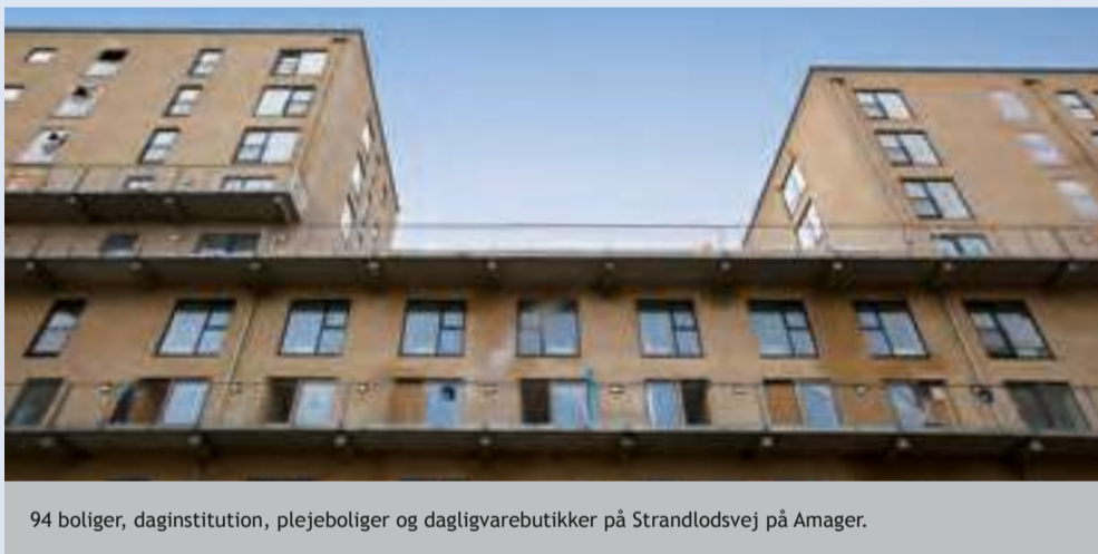
94 boliger, daginstitution, plejeboliger og dagligvarebutikker på Strandlodsvej på Amager.