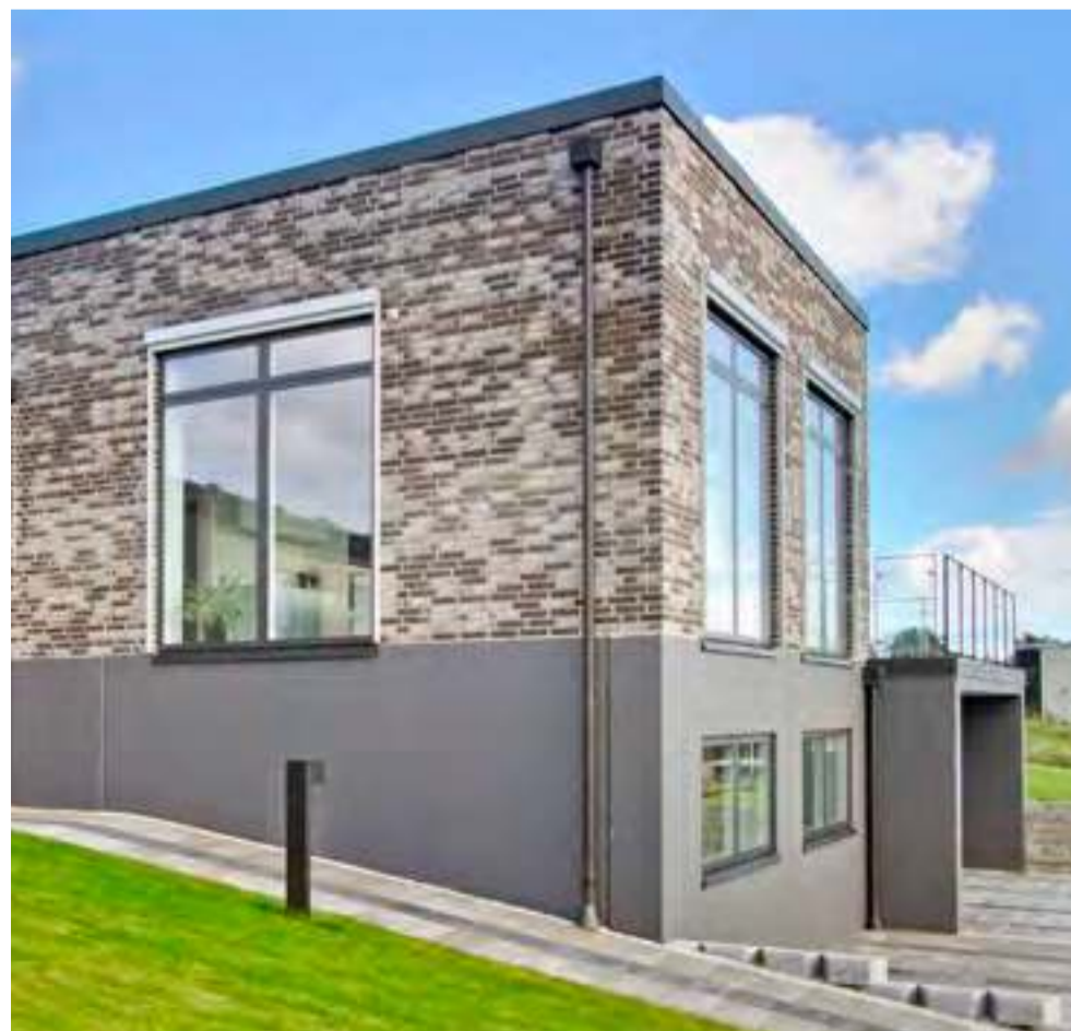
Valgfri facadeløsninger på EXPAN Vægelementer.

Se film om at bygge boliger med beton på