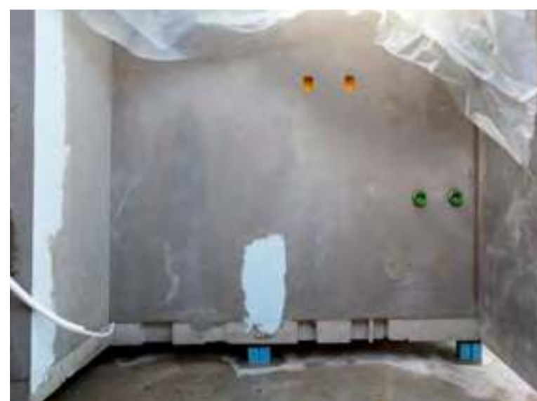
I højre side af badeværelset er væggene til tekøkkenet allerede klar - inkl. rørføring til vand og elinstallationer.