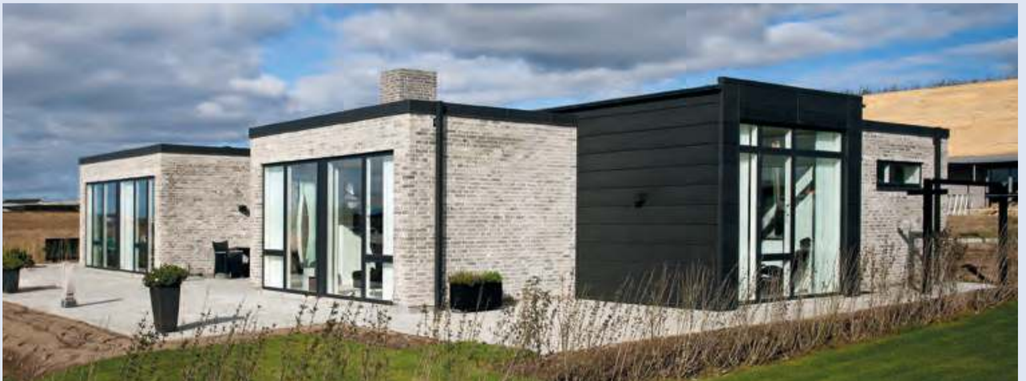
Villa i Aarhus-området.