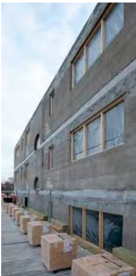
Boliger på Ringstedvej i Roskilde.