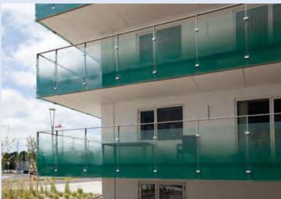
45 lejligheder, Marina House på Aarhus Havn.