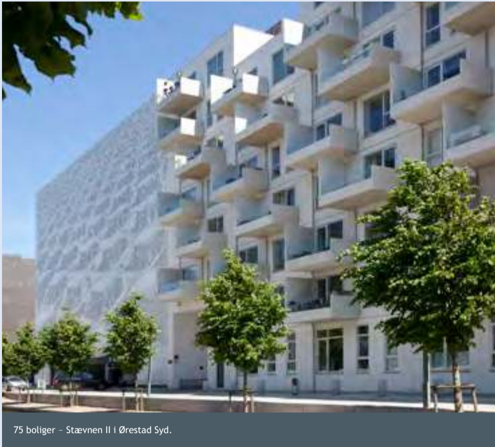
75 boliger - Stævnen II i Ørestad Syd.