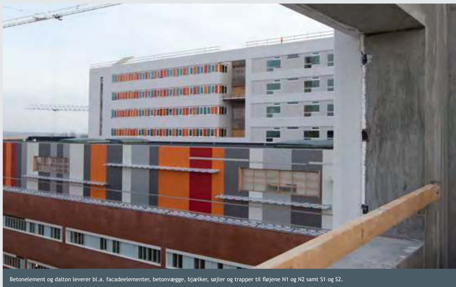
Betonelement og dalton leverer bl.a. facadeelementer, betonvægge, bjælker, søjler og trapper til fløjene N1 og N2 samt S1 og S2.

23.475 m 2 betonvægge 8.177 m 2 facader 1.498 tons søjler 74 tons bjælker 2.173 m 2 huldæk 571 m 2 TT-dæk 220 m 2 altaner