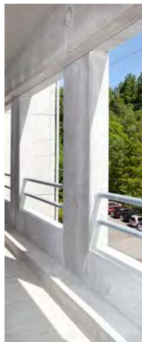
P-hus, Vejle Sygehus.