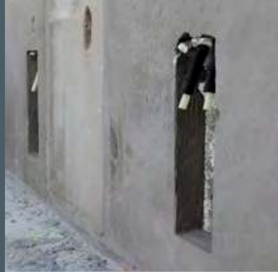
Kabler til solafskærmning, vand- og varmerør samt el indstøbes i elementerne.