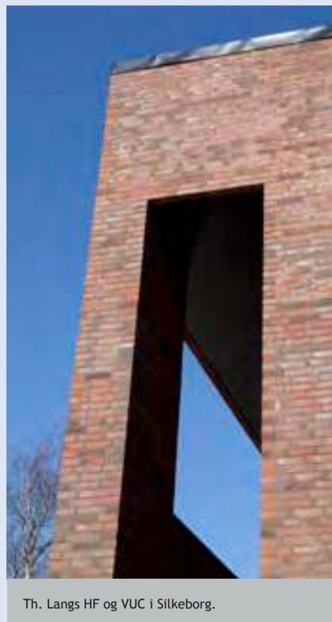
Th. Langs HF og VUC i Silkeborg.