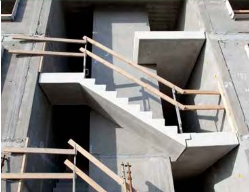
Boliger, Kirkebjerg Allé i Vanløse.

- Så snart vi er enige om planlægningen, kan jeg overlade styringen til EXPAN, og jeg skal ikke blande mig i hverdagen. ”