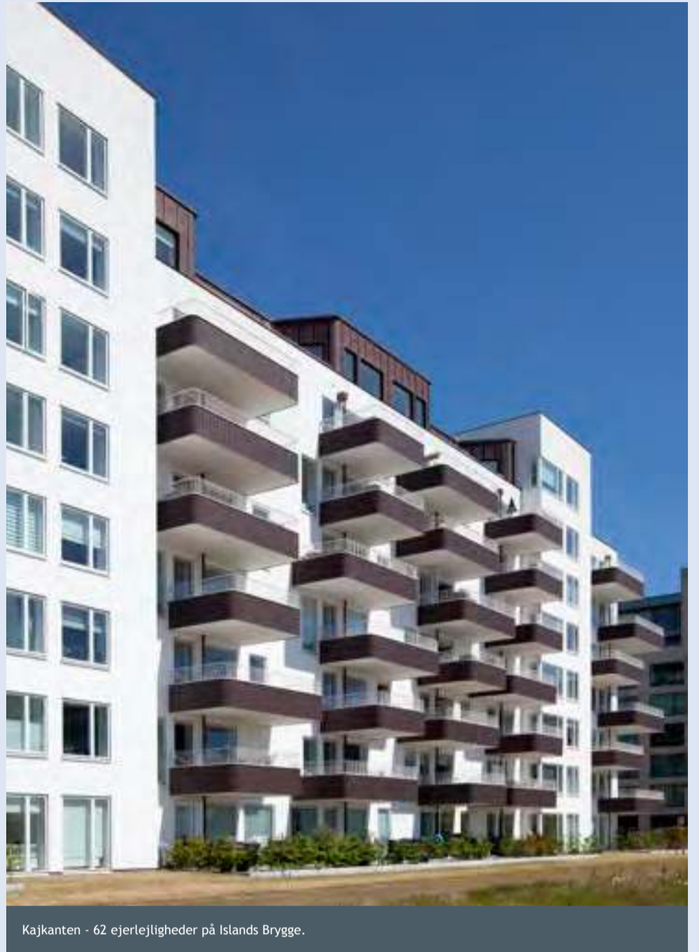
Kajkanten - 62 ejerlejligheder på Islands Brygge.