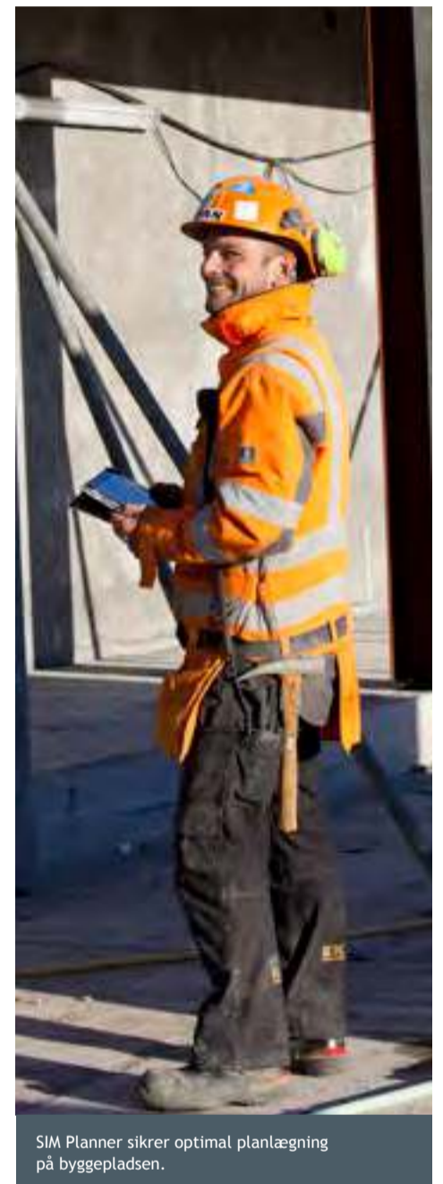
SIM Planner sikrer optimal planlægning på byggepladsen.