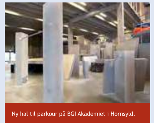
Ny hal til parkour på BGI Akademiet i Hornsyld.