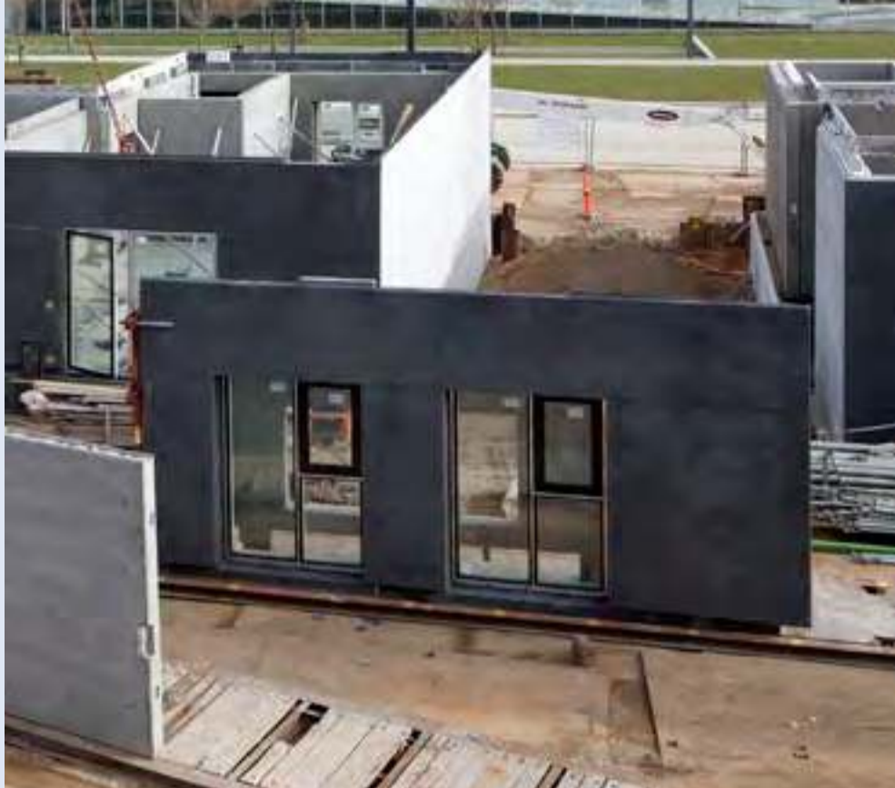
81 boliger i Ørestad Syd - 5 til 11 etager faldende mod udsigten over Fælleden. Facadeelementerne leveres med vinduer monteret fra fabrik.