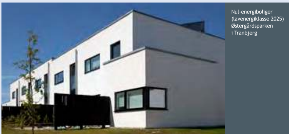
Nul-energi boliger (lavenergiklasse 2025) Østergårdsparken i Tranbjerg