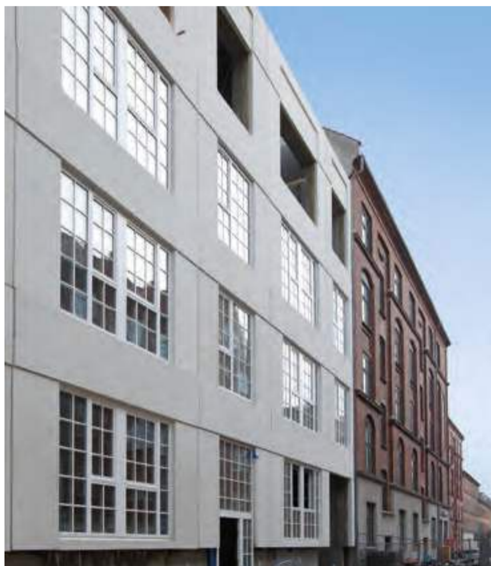
Udfyldningslejligheder. Factory House, liebhaverlejligheder i new-yorker-stil med have på taget.

Betonelement · dalton · EXPAN · EXPAN Montage · EXPAN Villa · ModulBad