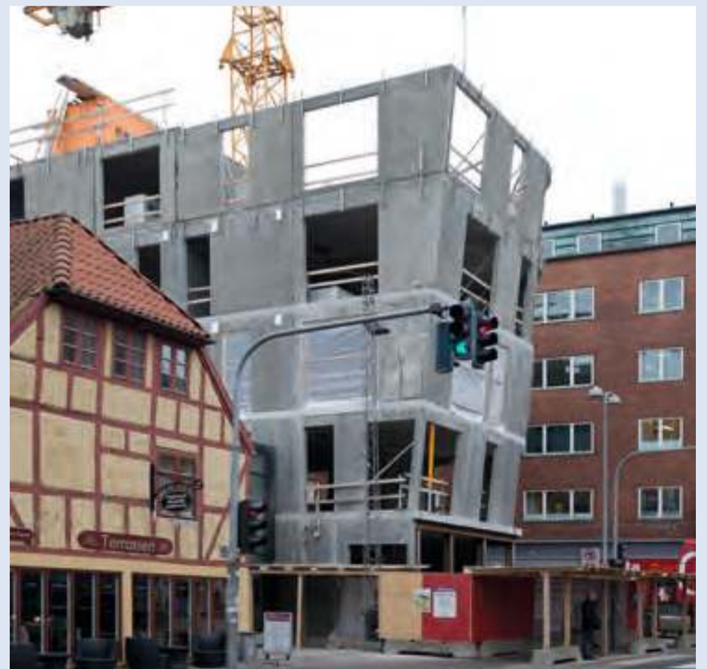
Runde og skæve elementer til Vesterbro i Aalborg.