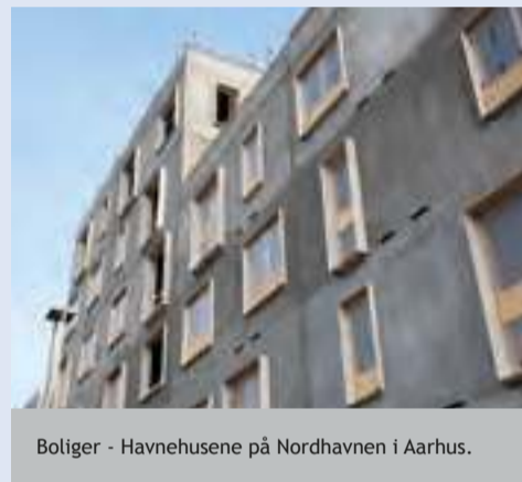
Boliger - Havnehusene på Nordhavnen i Aarhus.