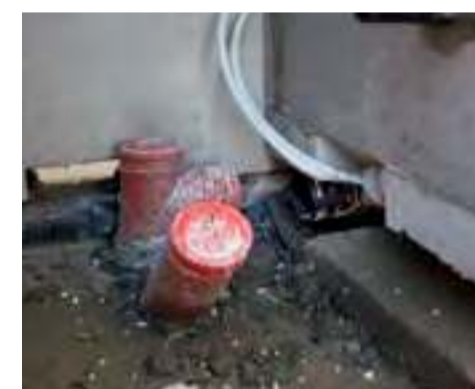
Let og enkel tilslutning af badeværelset ude på byggepladsen.

- Det har stor betydning for bundlinjen, for der kan hurtigt forsvinde et seks-cifret beløb, hvis logistikken halter. Der gør vi en stor forskel, siger salgsschefen. ■